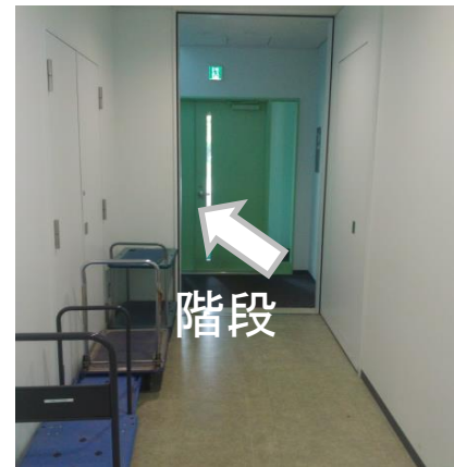
⑦突き当たり左の階段へ