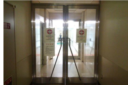
④扉が2つ開けて直進