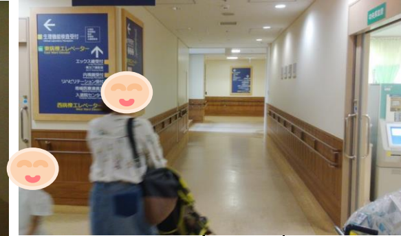
③中央採血室の前を左折